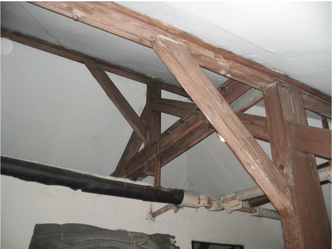
poddasze - konstrukcja wieszakowa więźby dachu