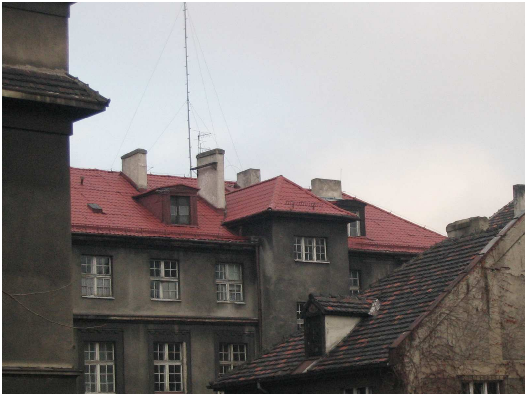
widok dachu od podwórza