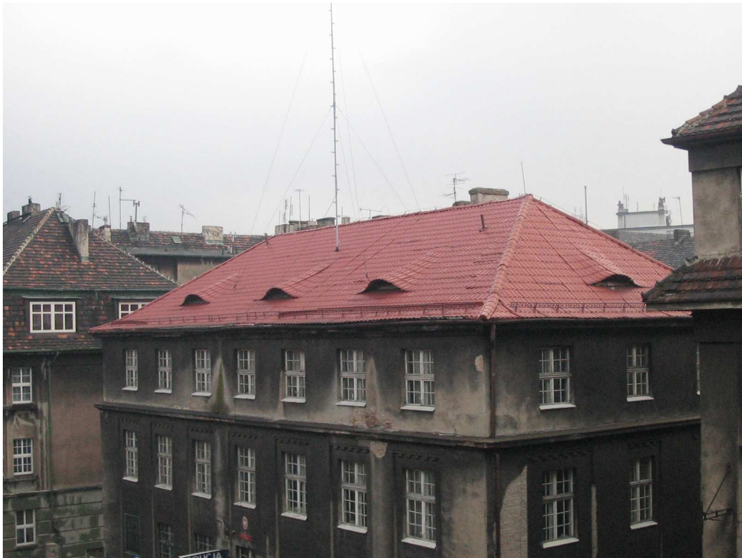
widok dachu od ul. Chrzanowskiego