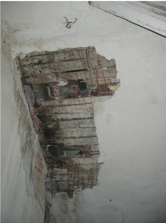
widok zwilgotniałego odcinka więźby (krokiew koszowa przy klatce schodowej)