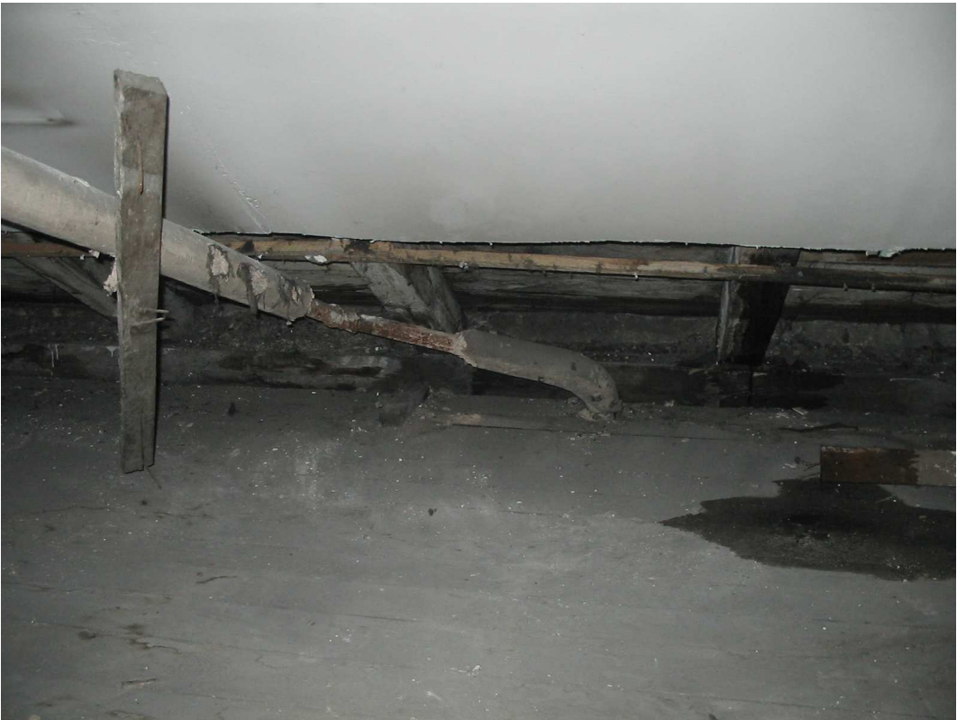
poddasze - widoczna odkrywka więźby oraz zacieki powstałe na skutek przecieków